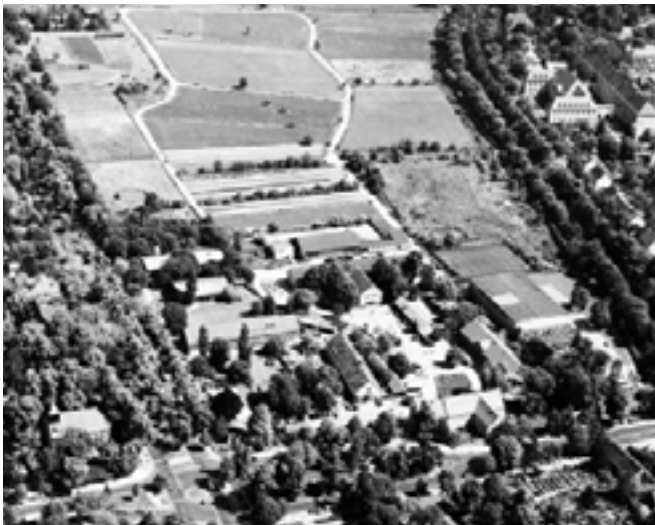
Luftaufnahme von der Domäne Dahlem

Mit einer Ökumenischen Andacht zur Geburtstagsfeier mit Pfarrer Dekara und Kaplan Bodenmüller am Sonntag, dem 9. Oktober, um 15 Uhr im Gutsgarten der Domäne Dahlem zwischen neuem Eingangsgebäude und Herrenhaus beteiligt sich auch die Evangelische Kirchengemeinde Dahlem an diesem bemerkenswerten Jubiläum. Herzliche Einladung an alle Gemeindemitglieder: Lassen Sie uns unsere Verbundenheit mit der Domäne Dahlem ausdrücken!