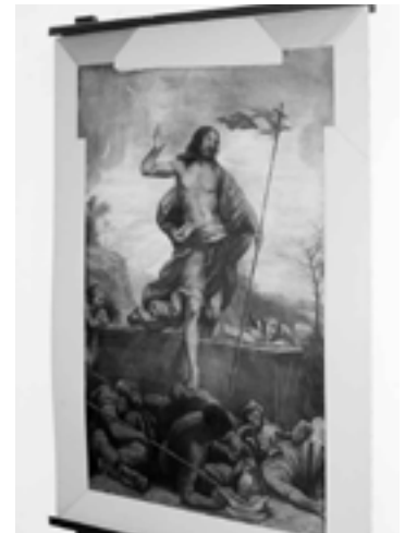
Altarbild; Auferstehung Jesu Christi